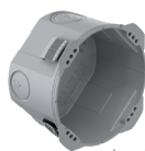
Gr. 1x1, 50 mm