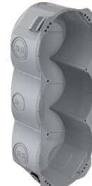
Gr. 3x1, 65 mm