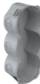
Gr. 3x1, 50 mm