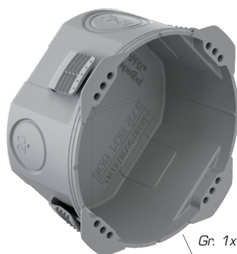
Gr. 1x1, 40 mm