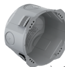
Gr. 1x1, 65 mm