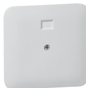
Cache à emboîter pour boîte de dérivation encastrée