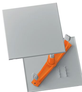
con barra diagonale, grigio