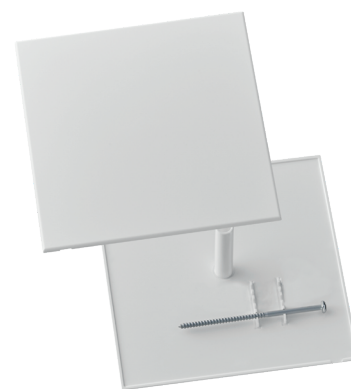
con vite al centro, bianco