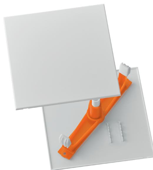
con barra diagonale, bianco