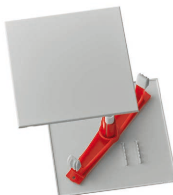
avec traverse diagonale, gris