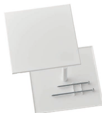
avec boulon central, blanc