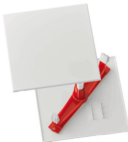
avec traverse diagonale, blanc