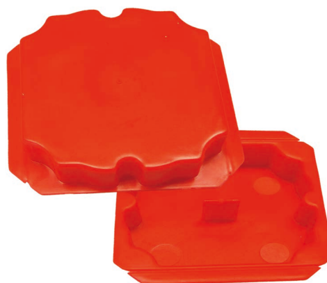
Cache de protection