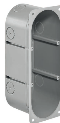
Gr. 3x1, profondeur de pose 65 mm