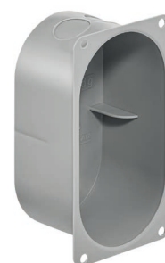
Gr. 2x1, profondeur de pose 50 mm