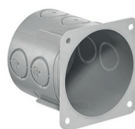
Gr. 1x1, profondeur de pose 65 mm